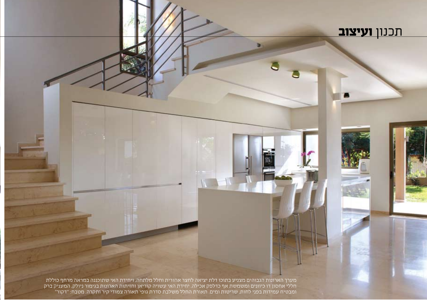
מערך הארונות הגבוהים מצניע בתוכו דלת יציאה לחצר אחורית וחלל מלתחה, ויחידת האי שתוכננה במראה מרחף כוללת חללי אחסון דו כיוונים ומשמשת אף כדלפק אכילה. יחידת האי עשויה קוריאן וחזיתות הארונות בגימור ניולק, המעניק ברק ומבטיח עמידות בפני לחות, שריטות ומים. תאורת החלל משלבת סדרת גופי תאורה צמודי קיר ותקרה. מטבח: "דקור"