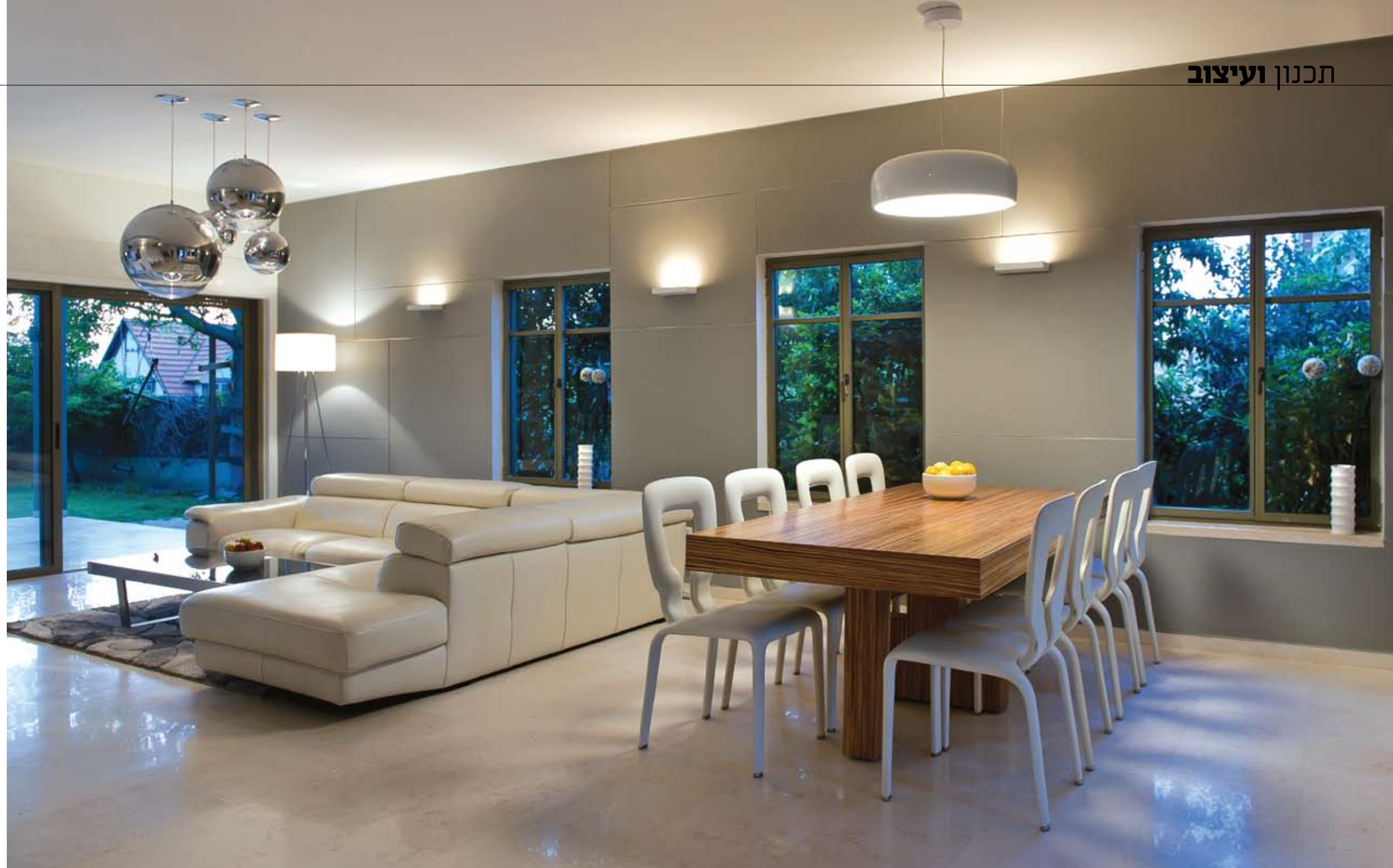
הסלון: "נהנה" מהמרחב החדש שנפתח בפניו עם ספה פינתית בעיצוב עכשווי וממדים נדיבים וגופי תאורה מעוצבים שהותאמו ייעודית למיקומם במרחב. ליצירת עניין וכתחליף לתמונות "הולבש" הקיר במראה של לוחות, שהתקבל ע"י חלוקתו לתצורות מרובעות באמצעות פרופילי U וחיפוי בטיח אפור בחספוס עדין.

המשמשת את בעל הבית לטיפול בתחביב אופני השטח שלו. הדלת נטמעת בתוך מערך החזיתות כך ש"לא נודע כי באה אל קרבו", ובאותה רוח שילבה שטרנהיים בתוכו גם חלל מלתחה לתליית מעילים, המבטיח שהסדר אכן יישמר על כנו. יחידת האי המעוצבת במראה מרחף עשויה מקוריאן ומשמשת כדלפק אכילה ל-6 סועדים, כאזור בישול וכן לצרכי אחסון דו כיווני (הן כלפי המטבח והן כלפי הסלון), ולחזיתות הארונות הגבוהים הוענק גימור ניילוק, העוטה מראה מבריק וניחן בעמידות גבוהה בפני שריטות, לחות ומים. מעברה השני של יחידת האי ממוקמים אזורי הסלון ופינת האוכל, המשמרים קשר עין ישיר עם המטבח ונהנים מהמרחב החדש שנפתח בפניהם: באזור הסלון הוצבה ספה פינתית מודרנית בעלת ממדים נדיבים, ואזור פינת האוכל עטוף בפתחים הפונים אל הגן ואל הפטיו ואת השולחן שהוצב בו ניתן להגדיל בעת אירוח רב משתתפים ללא כל חשש של היעדר מקום.