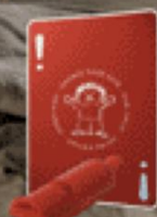
Děkujeme všem partnerům této kampaně.

Cena SMS je 30 Kč, Nadace Naše dítě obdrží 27 Kč. Službu SMS zajišťuje Fincom s.r.o.