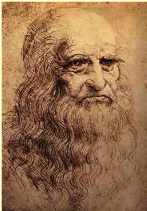
הזקן ממילנו ליאונרדו דה-וינצ'י

המאמר מבוסס על הרצאה שניתנה במכללת יזרעאל במסגרת סדרת הרצאות על הנושא: "היבטים פסיכולוגיים וטיפוליים בגיל השלישי"