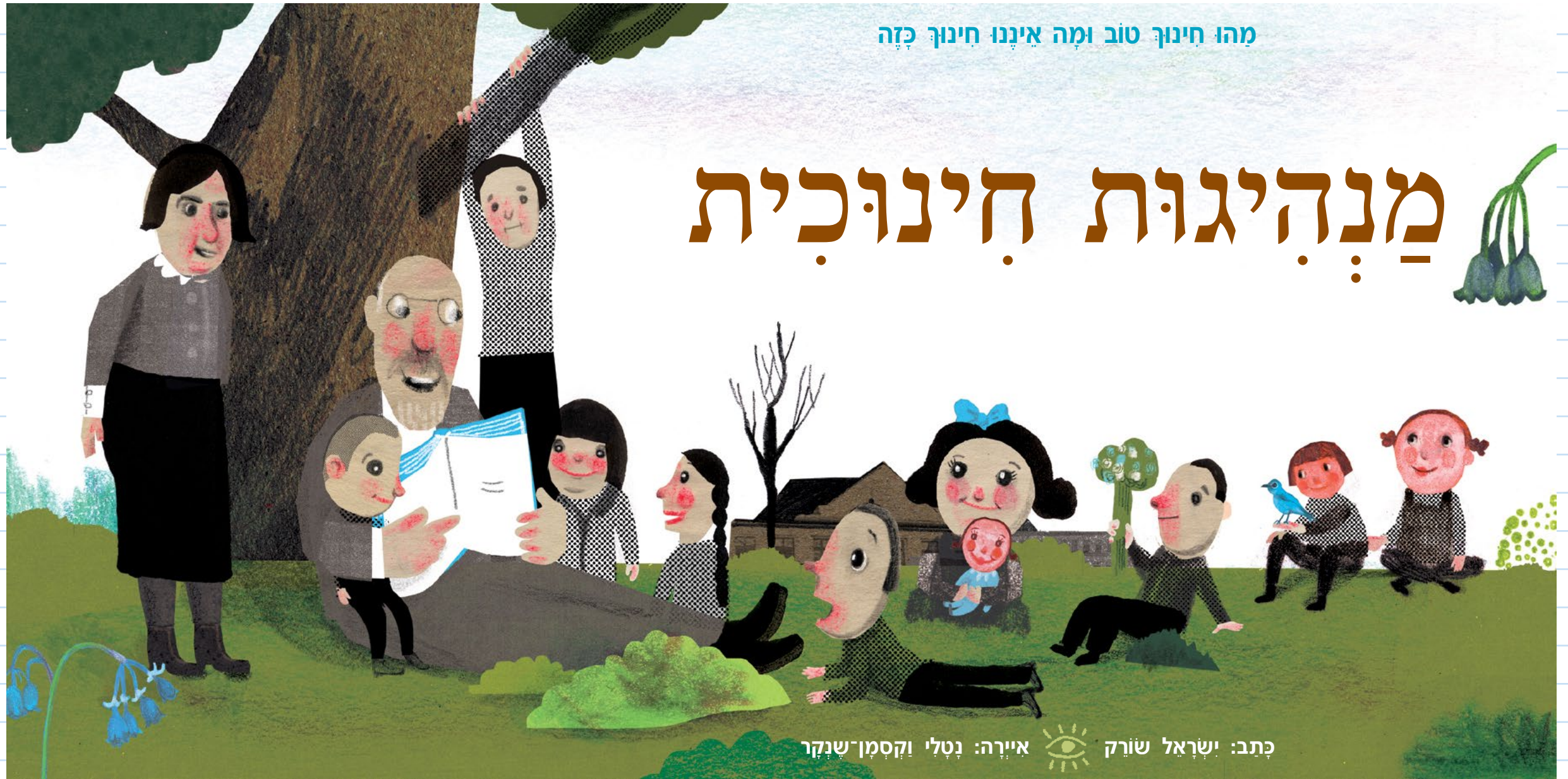
כתב: ישראל שורק איירה: נטלי וקסמן-שנקר

לתפקד רק בעולם של מחר או להצליח רק בו. האדם אמור לחשוב בעצמו, להיות בעל ביטחון עצמי, להיות סובלני, רגיש לזולתו. את כל הדברים האלה אי אפשר להשיג אם מדמים את החינוך למכירה של מוצר. מנהיגות חינוכית, כמו כל מנהיגות אחרת, מוכרחה לנוע 'נגד הזרם' (ולא – מי צריך אותה?) ולכן אין טעם לדרוש ממנה לרצות את דעת הקהל, למשל, את ההורים. מנהיגות חינוכית יכולה להשתמש בכל חידושי הטכנולוגיה, אבל חידושי הטכנולוגיה אינם יכולים להיות התוכן של המנהיגות החינוכית.