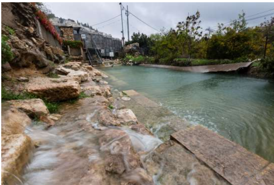
第二圣殿时期的西罗亚水池。这座水池是耶路撒冷朝圣的中心地，根据新约，这是耶稣显现神迹治愈了一名盲人的地方（《约翰福音》9:7）。