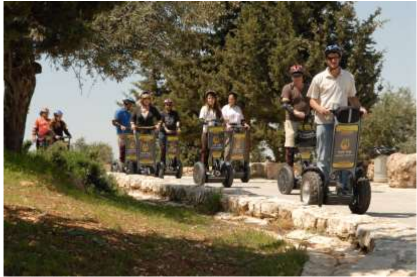
赛格威静谧森林游，欣赏耶路撒冷旧城风景