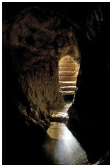
圣经基训泉 – 古耶路撒冷的发源地