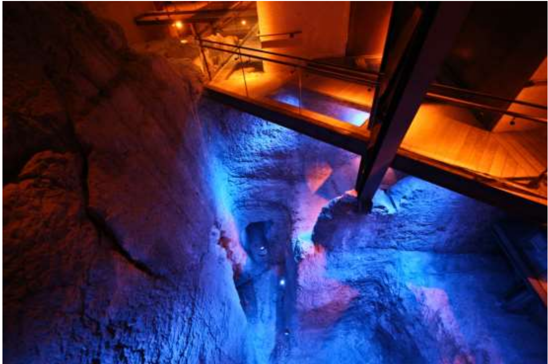
圣经中迦南时期的古泉城堡— 3800 年的城堡，在圣经中称为— .1 沙勒姆城（《创世记》 14， 18）