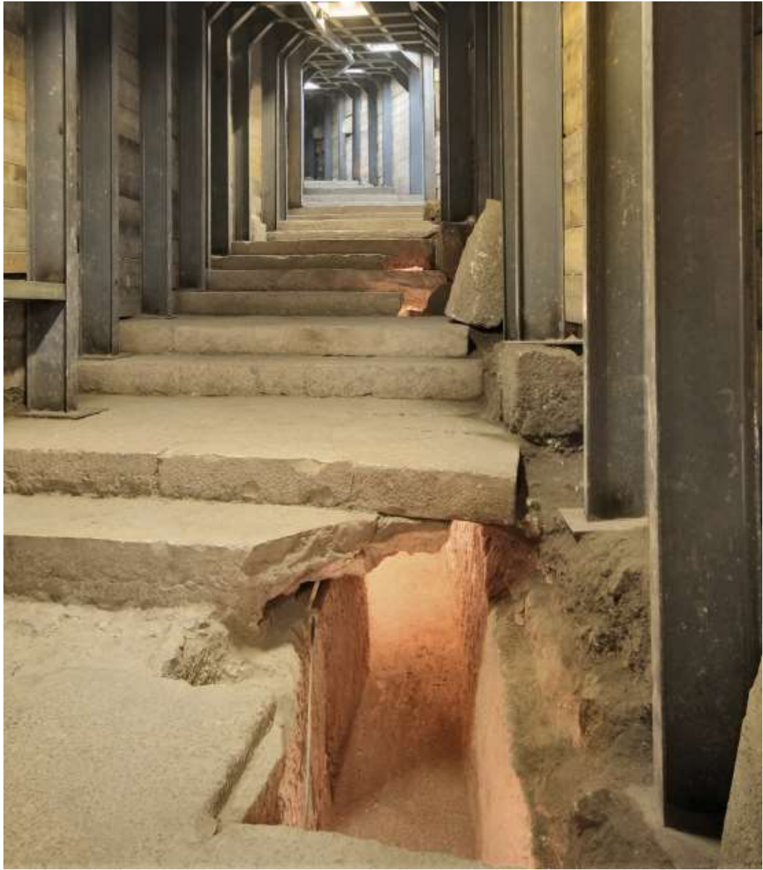
第二圣殿时期的壮观朝圣路线 – 从西罗亚水池通往圣殿的街道