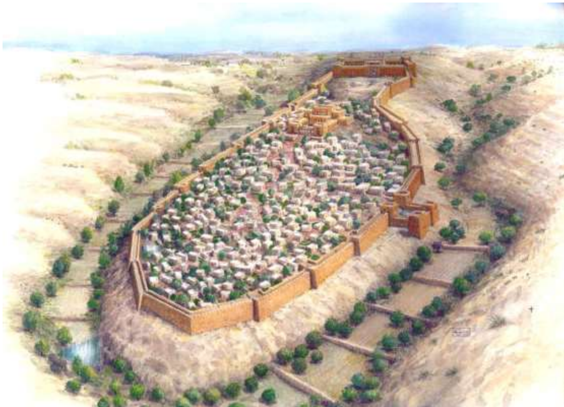
公元前 950 年圣经中的大卫城的重建模型