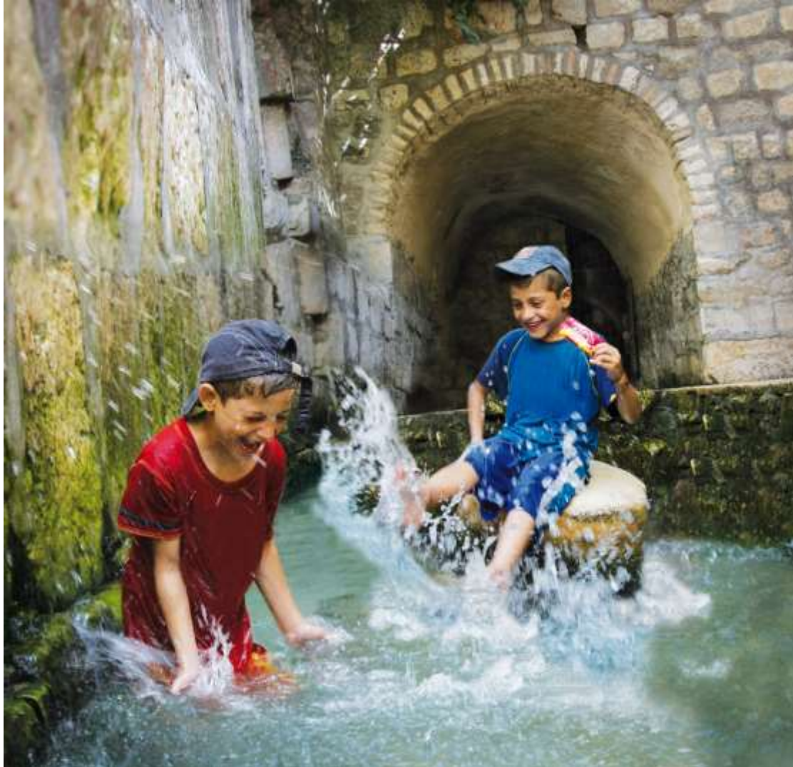
在水上远足，穿过希西家水道后，孩子们在西罗亚水池中玩耍