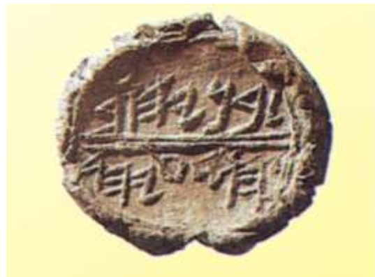
古代圣经印刷品，上面有圣经官员的希伯来文名字 – 2600 年历史