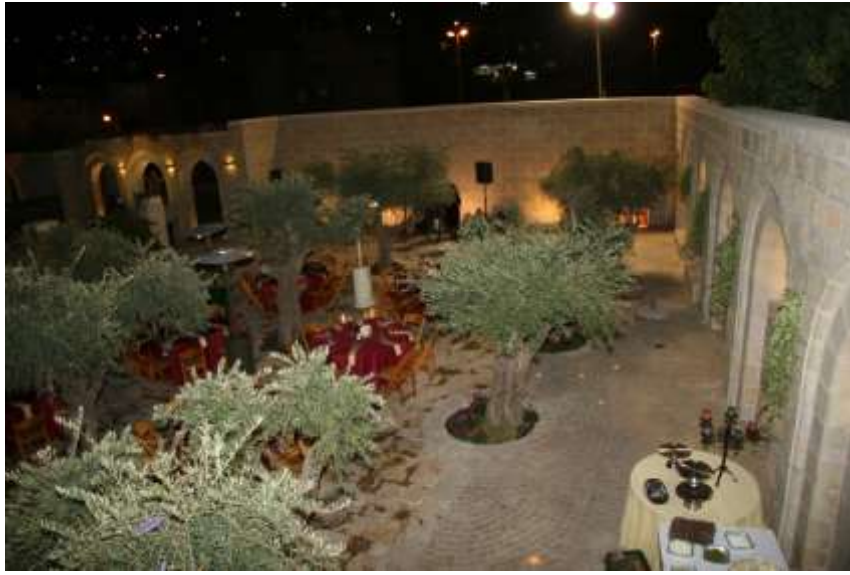
大卫之城国家公园的入口