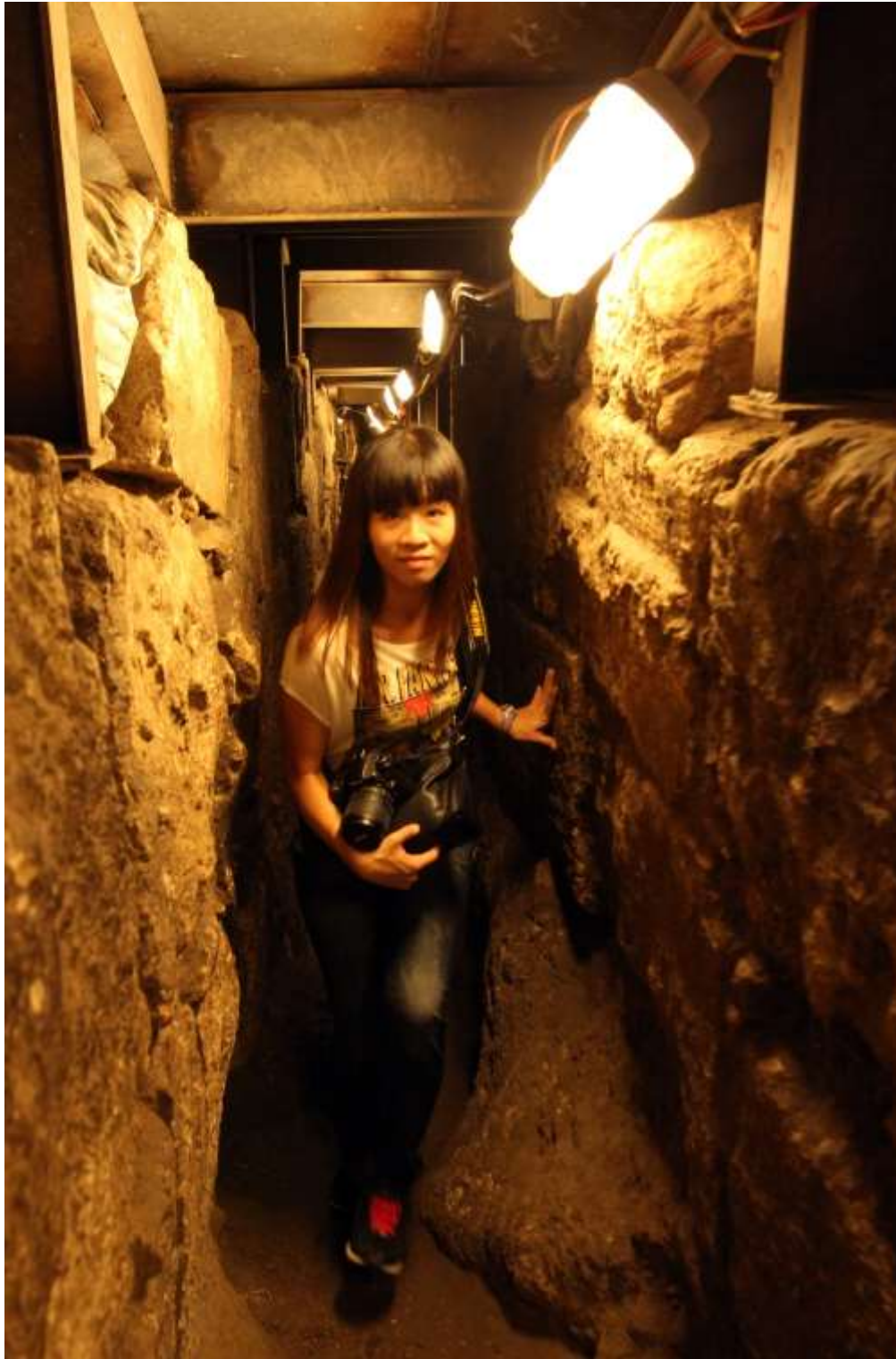
在第二圣殿时期的崎岖隧道中行走